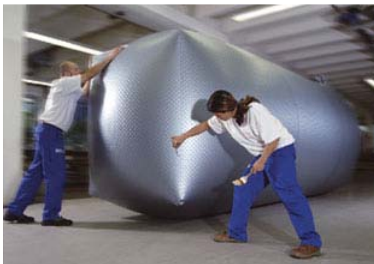
Стендовые испытания на герметичность