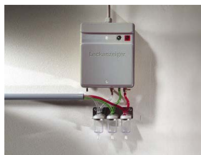
Вакуумный детектор утечек