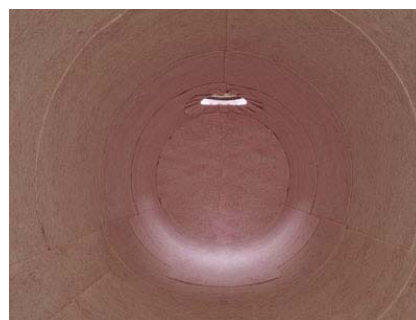
Установка проницаемого мата