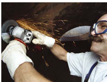
Удаление острых деталей