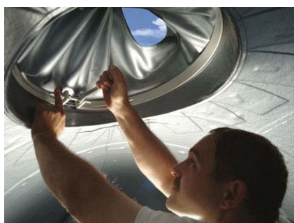
Установка уплотнения люка